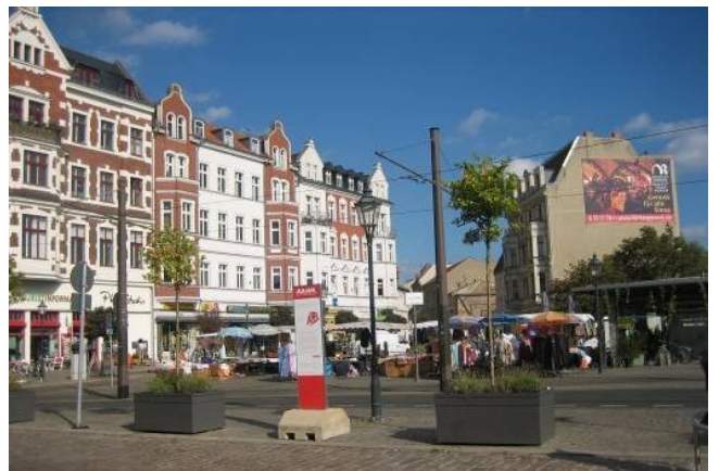
Schloßplatz nach der Umsetzung