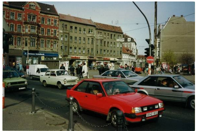
Schlossplatz vor der Umsetzung