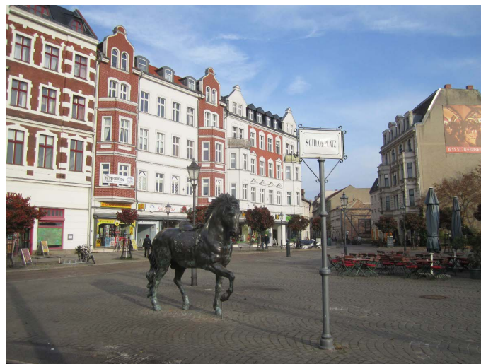
Altstadt nach dem Umbau

Mit den benannten Zielen/Ergebnissen der Lärminderung und den damit verbundenen wesentlichen Änderungen der Verkehrsführung in der Altstadt wurde eine Attraktivitätserhöhung des Gesamttraumes der Altstadt Köpenick bewirkt. Es hat sich eine Wandlung in der Struktur der Altstadt vollzogen, die sich positiv auf die Weiterentwicklung des Wohnstandorts und auch auf Grund der Wasserlage ebenfalls positiv auf die Entwicklung zu einem touristischen Anziehungspunkt mit vielfältigen gastronomischen Einrichtungen und hoher Aufenthaltsqualität auswirkt.