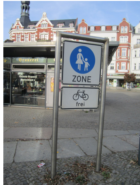
Altstadt nach dem Umbau