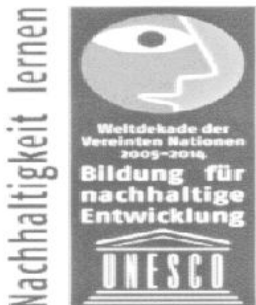
Bild: Auszeichnung der UNESCO für den FÖN e.V.