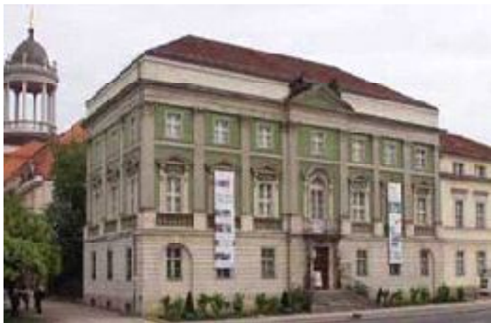
Das Naturkundemuseum Potsdam in der Breiten Straße