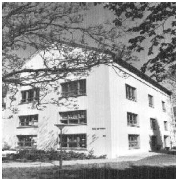
Haus der Natur in Potsdam