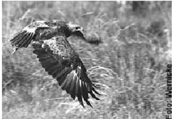
Schreiadler im Flug

Nun stellte sich heraus, dass das gesamte Eignungsgebiet im sogenannten Restriktionsgebiet (Zone zwischen 3.000–6.000 m um einen Horst) zweier Horststandorte des Schreiadlers liegt. Ein Fünftel des Windeignungsgebietes, in dem keine Anlage in Planung ist, liegt sogar im sogenannten Tabubereich (0–3.000 m um