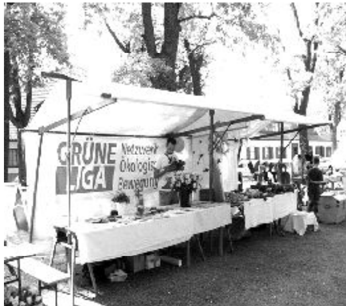
Blumiger Blütenstand der GRÜNEN LIGA auf dem Blütenfest