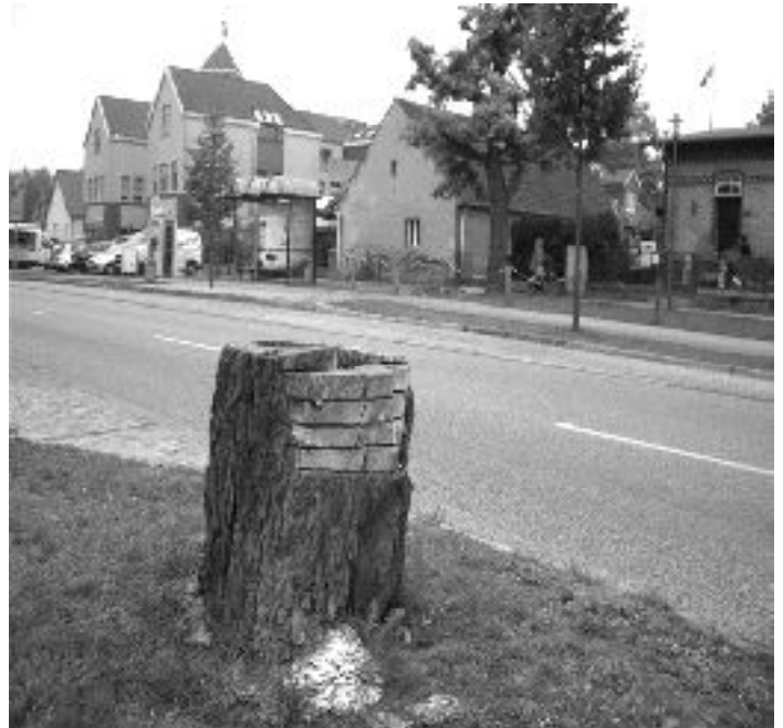
Stumpfkultur 2006 in Großbeeren