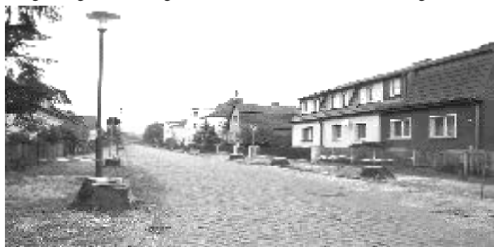
Lindenstraße in Großbeeren ohne Linden

Mit der Naturvernichtung wandelt sich auch der Dorfcharakter. Prägende Landschaftselemente verschwinden. Dorftypisches geht verloren. Wie vielerorts in Brandenburg verkommt das Dorfbild von Großbeeren zu dem Anblick typisch geschmackloser, langweiliger Siedlungen westdeutscher Art. * Regina Witt