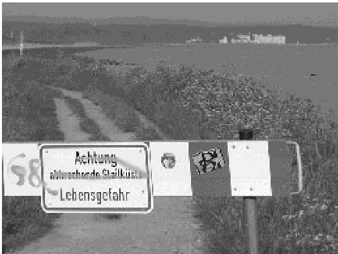
Die weißen Fassaden Heiligendamm sind in der Ferne – nur zu erreichen unter Lebensgefahr?

Heiligendamm ist Geschichte, welche Lehren müssen gezogen werden? Was infolge umfangreicher, allerdings oft übertriebener Medienberichten bleibt, sind die Bilder von Jagdszenen während der Demonstration am 2. Juni in Rostock zwischen uniformierten Ordnungshütern, sprich Polizei, und den zu meist jugendlichen „Gipfelstürmern“, also den Demonstranten. Ich war selbst am 8. Juni inmitten der „Sitz-Blockierer“ vor Heiligendamm und habere ein Bild machen können, was wirklich dort geschehen ist. Zu diesem Zeitpunkt war jedoch auf beiden Seiten bereits wohlthuende Normalität zu spüren. Trotzdem waren meine Eindrücke wiespältig: Auf der einen Seite gereizte Polizeieinheiten – euphorische und siegbewusste Demonstranten auf der anderen Seite. Immerhin hatten sie es geschafft, die gerichtlich verordnete Bannmeile um den „Hochsicherheitszaun“ vor Heiligendamm zu unterlaufen. Aus den schlimmen Gewaltexzessen von Rostock müssen natürlich Lehren gezogen werden. Erfreulich, die Organisatoren der bunten Gruppen der Globalisierungsgegner hatten sich rechtzeitig eindrucksvoll zur Gewaltlosigkeit bekannt. Damit waren die Voraussetzungen gegeben, dass die drei kritischen Tage des eigentlichen G8-Treffens eingemeißelt friedlich verliefen.