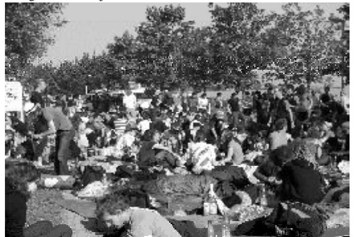
Sitzblockade an der Zufahrtsstraße von Börgerende, vor Heiligendamm