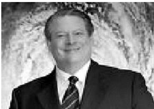
Nobelpreisträger Al Gore vor Hurrikanfoto