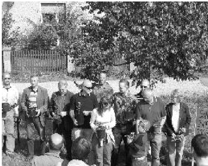
Vertreter aus 15 Lausitzer Dörfern nehmen in Lacomau kleine Bäumchen vom Hammergraben in Empfang um sie zuhause zu pflanzen

nicht mehr bedrohen werden. Ihren Kampf gegen den Tagebau Cottbus-Nord und um den Erhalt der Lacomauer Teiche musste die Grüne Liga jedoch aus den dargestellten Gründen einstellen. Nun gilt es insbesondere die Lausitzer Dörfer politisch zu unterstützen, die sich gegen eine künftige Inanspruchnahme wehren.