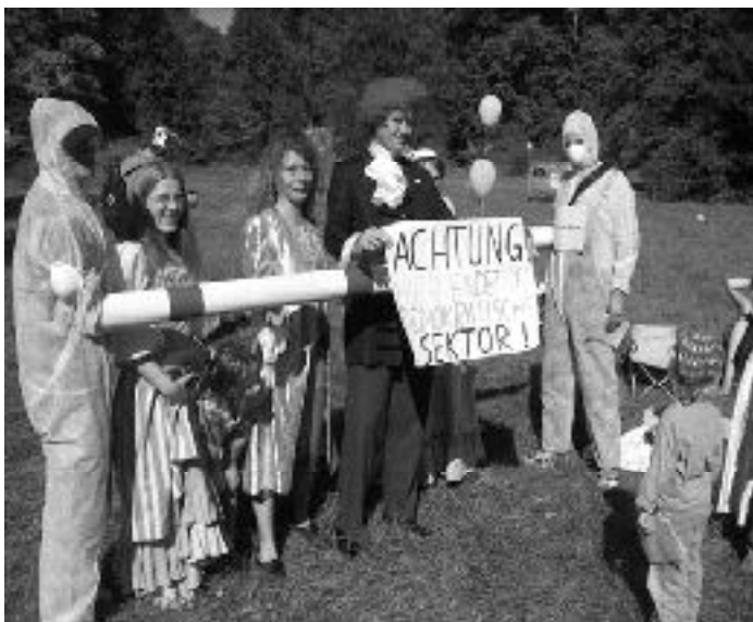
Lebendige Parkbarrieren und Warnungen an alle nicht dem Parkbild entsprechenden Gäste anlässlich des Parkfestes in Babelsberg